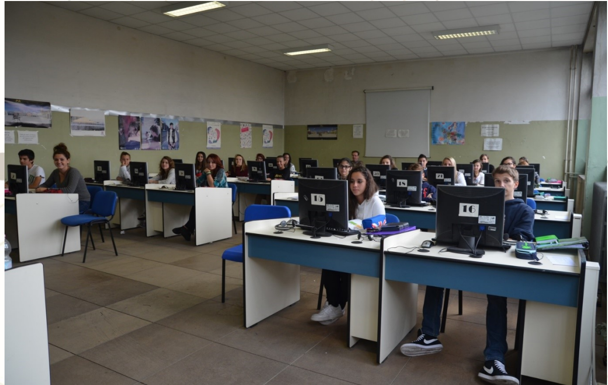
Il laboratorio linguistico