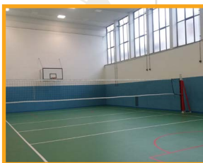
Una delle palestre